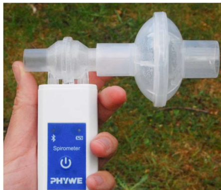
Rysunek 2. Spirometr z prawidłowo zamontowanym ustnikiem.