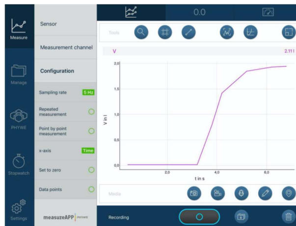
Rysunek 5. Przedstawienie danych pomiarowych do określenia IRV.