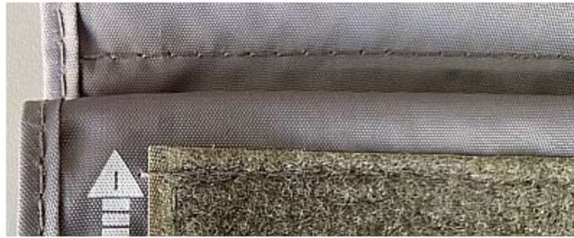
Rysunek 4. Prawidłowe zapięcie mankietu.