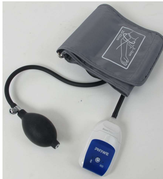
Rysunek 1. Cobra SMARTsense - czujnik do pomiaru ciśnienia krwi.

Czujnik posiada przycisk włączania oraz dwie diody LED do wskazywania statusu Bluetooth i naładowania baterii.