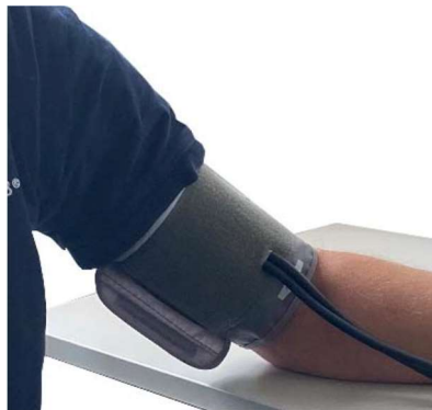
Rysunek 3. Prawidłowo założony mankiet.