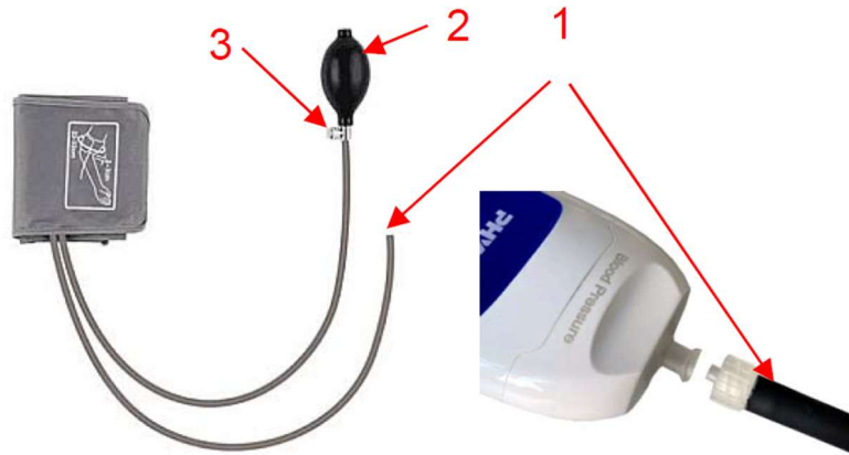
Rysunek 2. Sposób podłączenia mankieta do czujnika.