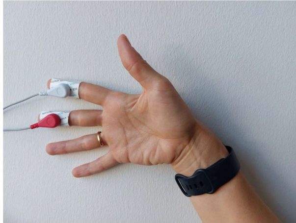
Rysunek 3. Sposób mocowania elektrod.

strony, elektrody nie mogą być zbyt mocno przyciśnięte, ponieważ nadmierna potliwość może niesłusznie podwyższyć wartość przewodności skóry.