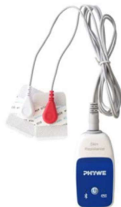
Rysunek 1. Cobra SMARTsense Skin Resistance.