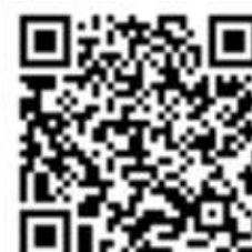
Rysunek 2. Od lewej dla Androida, iOS i Tablet/PC z Windows 10.