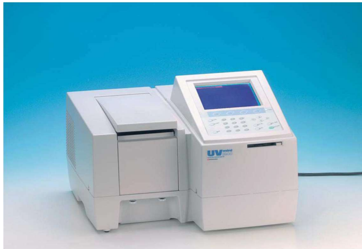
Rysunek 2. Spektrofotometr (190-1100 nm).