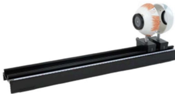
Rysunek 1. Model oka na stacji profilowej.